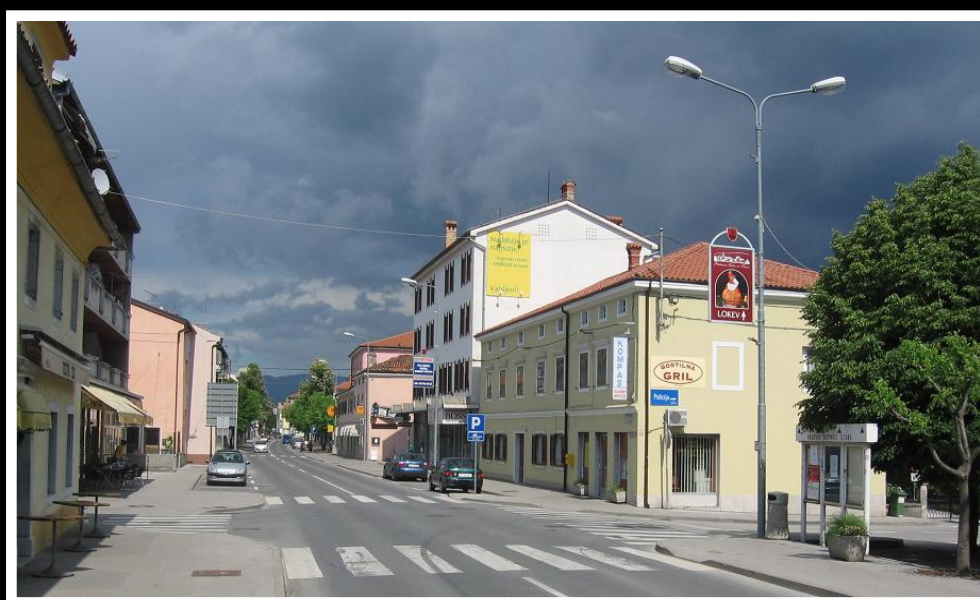
Sesana . Hauptstraße.

Bis zu Grenze waren von dort vielleicht 8 km, bis nach Triest, dort wollte ich hin, etwa 35 km Fußweg durch unwegsames Gelände (Karst). Für das letzte Geld eine Tasse Kaffee im Warmen getrunken und dabei die Gäste im Cafe beobachtet. Ich dachte mir, dass mir ein Italiener helfen könnte. So war es dann auch. Da stand ein kleiner italienischer Wagen (Fiat 500), zu dem ein junger, gut gekleideter Mann ging. Ich hinterher.