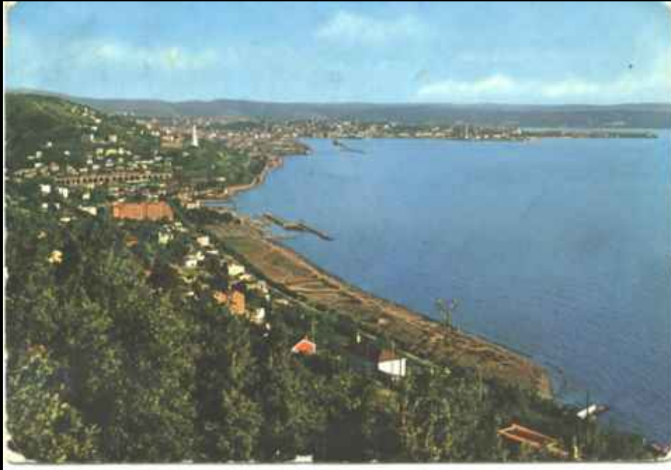
"Saluto Cordiali d'Italia . Triest

Das war die erste Postkarte, aus der Freiheit abgeschickt.