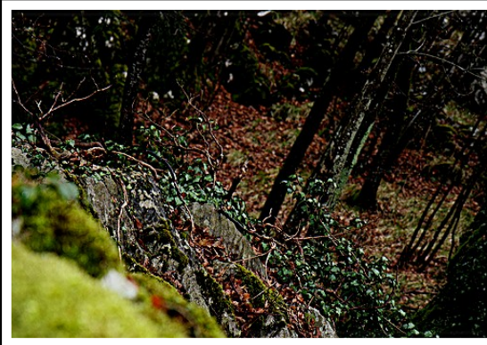
Karst, das Gelände. Höhenunterschied. 400 m.